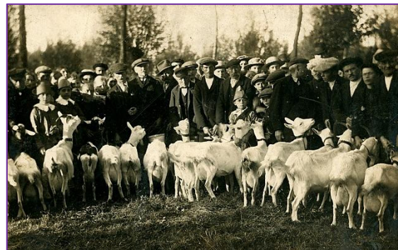
Terheijdense Geitenfokvereniging.